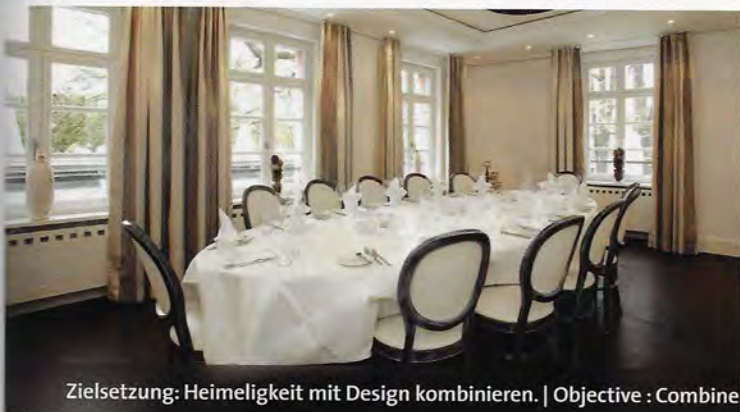
Zielsetzung: Heimeligkeit mit Design kombinieren. | Objective : Combine coziness with design.